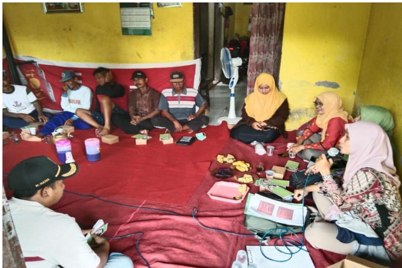
Gambar 1 Seminar Pupuk Organik

Dari beberapa observasi yang dilakukan kelompok B selama KKM di Desa Sebani sangat banyak menjumpai kotoran kambing yang ternyata tidak banyak orang tau akan proses pengolahan limbahnya. Dari beberapa masalah tersebut kami mengadakan workshop dan menghadirkan narasumber dari Penyuluh Dinas Pertanian dan mendapat respon yang sangat baik sehingga warga masyarakat sebani tau akan tentang bagaimana memanfaatkan limbah kotoran kambing dengan benar dan tepat. Sehingga diketahui setelah acara workshop tersebut kita melakukan observasi kepada masyarakat dan didapati banyaknya masyarakat yang telah mengelolah limbah kotoran kambing tersebut untuk dijadikan pupuk,