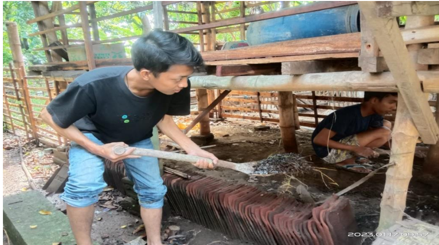
Gambar 2 mengumpulkan kotoran kambing

dan dari hasil pupuk yang telah jadi kami dari Kelompok B membantu untuk mem packing dan mengajarkan dari pembuatan akun sampai tahap penjualan produk tersebut ke e-commers yang tersedia. Hasil dari penjualan pupuk akan di berikan secara langsung ke masing masing masyarakat sebagai produsen pupuk tersebut.