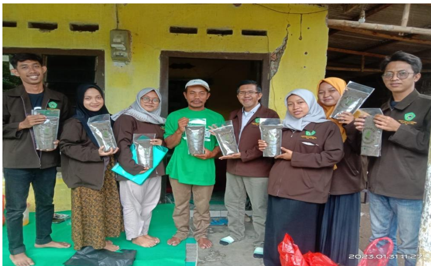
Gambar 3 Penyerahan Produk Pupuk Organic Kepada Ketua Poktan Sebani

Dari hasil observasi yang kita lakukan pada minggu pertama di Desa Sebani kami mendapati beberapa warga desa Sebani ternyata cukup banyak peternak kambing, dan kami mewawancarai salah satu peternak mengenai pemanfaatan limbah kotoran kambing, hasil yang kami temui ternyata para peternak masih belum banyak yang tau akan memanfaatkan kotoran kambing tersebut. Dan dari hasil observasi tersebut kami kelompok B menyusun satu proker yang meliputi tentang pemanfaatan limbah tersebut dari proses hingga menjadi produk yang layak jual. Sebagaimana judul proker kami “Meningkatkan Nilai Ekonomi Dengan Pemanfaatan Limbah Kotoran Kambing Sebagai Tambahan Pupuk Organik”.